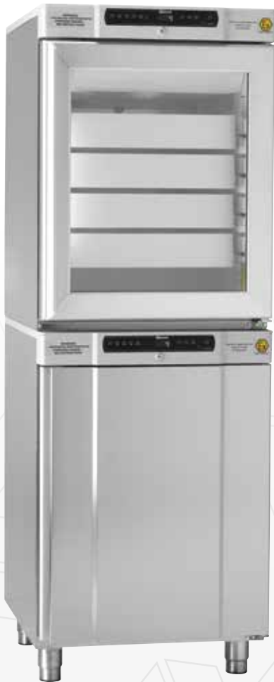
BioCompact II RR210/RF210. Lades en glasdeur als optie mogelijk.