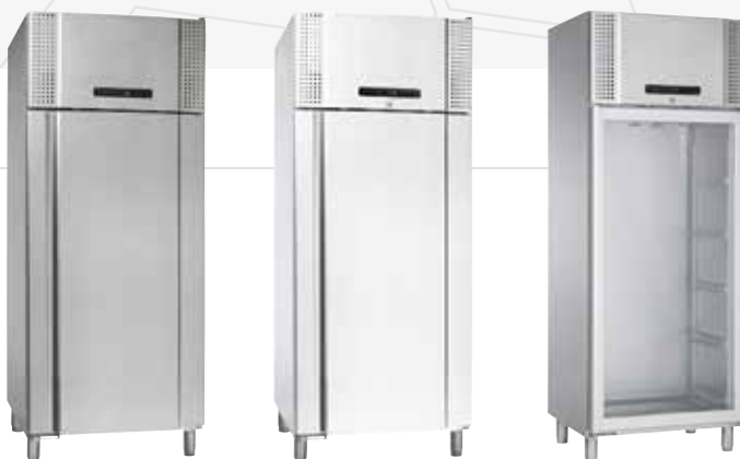
De BioPlus 600/660W is verkrijgbaar als koelkast of vrieskast in het wit of in roestvaststaal. Keuzemogelijkheid in glasdeur (alleen bij koeling) of dichte deur.

De meubelen zijn ook leverbaar zonder compressor voor separate aansluiting of op een centraal systeem.