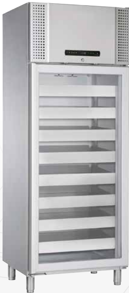
BioPlus 660W. Lades en glasdeur als optie mogelijk.

De BioPlus 600/660W serie is uitermate geschikt voor het bewaren van temperatuurgevoelige producten, waarbij iedere temperatuurschommeling grote invloed kan hebben op de producten.