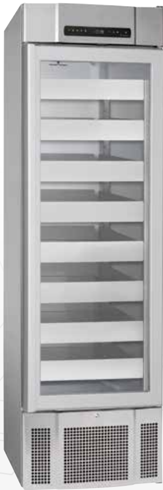
BioMidi 425. Lades en glasdeur als optie mogelijk.